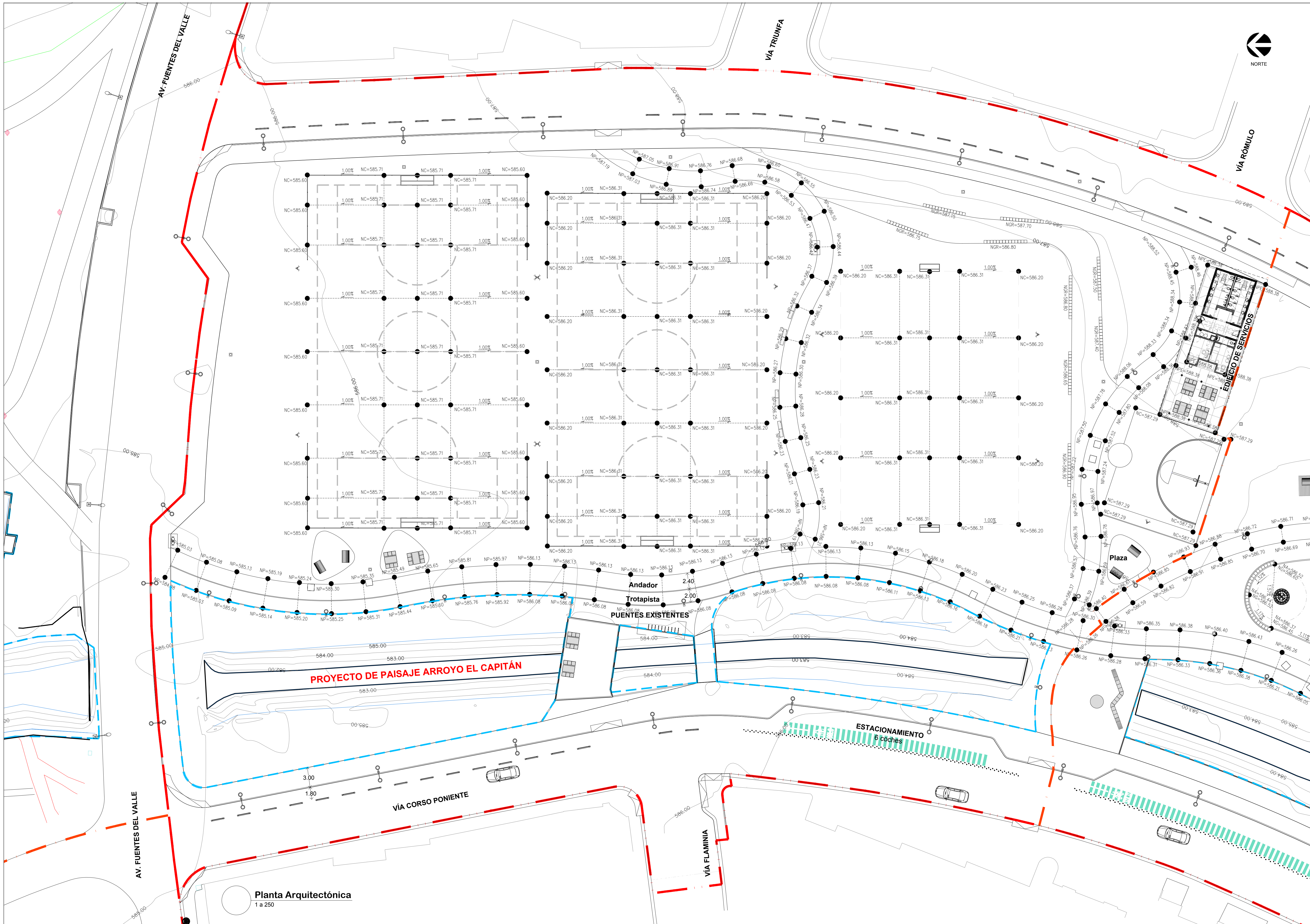
Planta Arquitectónica 1 a 250